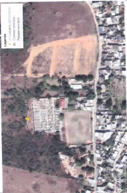
1 Localização do Prodlavamento esc. sem escala