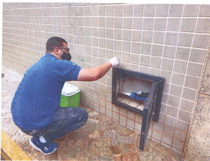
Coleta na Clínica CLINEFRON

■ Ampliação das ações da Gerencia de Controle da Qualidade da Água, com melhoria de processos de coleta de amostras, avaliação e gerenciamento dos dados analíticos, atendimento a reclamações inerentes à qualidade da água, bem como atendimento a situações de emergência.