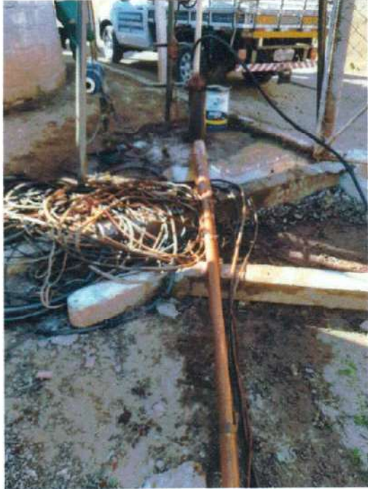
Figura 4;preparação para inicio da limpeza