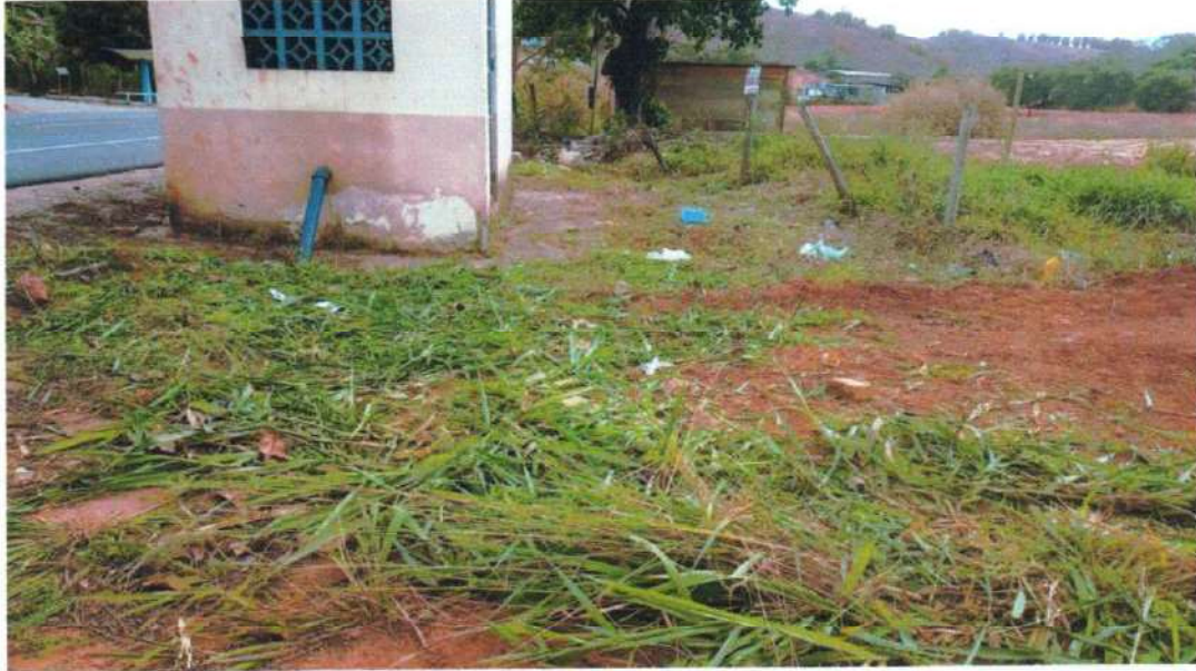
Figura 10; limpeza da Elevatoria de Marangatu.