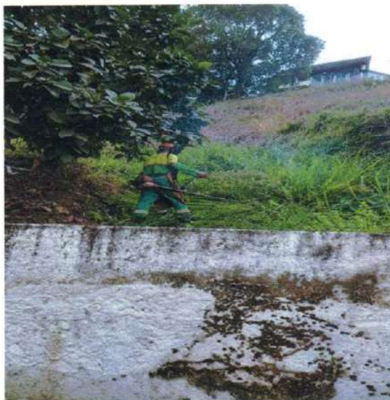
Figura 8; limpeza e roçada no terreno de escritório sede da empresa.