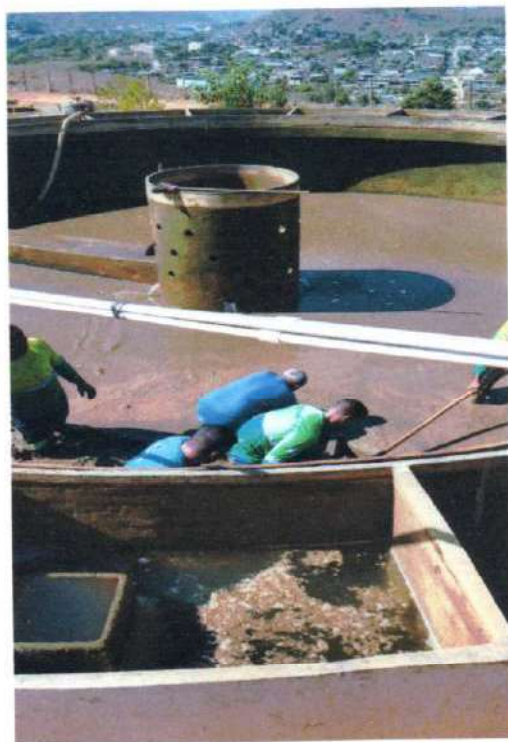
Figura 6; funcionários retirando todo o lodo do decantador.

Foi realizado o serviço de lavagem dos floculadores e decantadores da ETA para manutenção preventiva e limpeza.