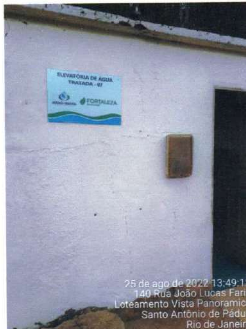
Figura 15; Vista externa da elevatoria