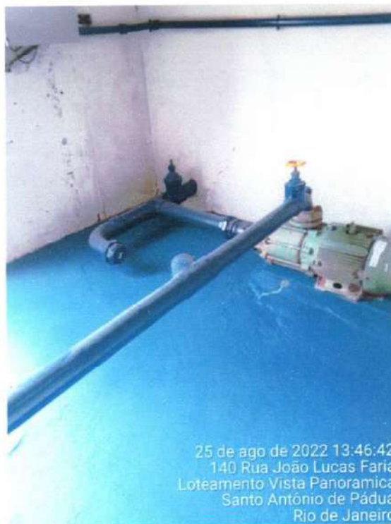
Figura 17; pintura já realizada