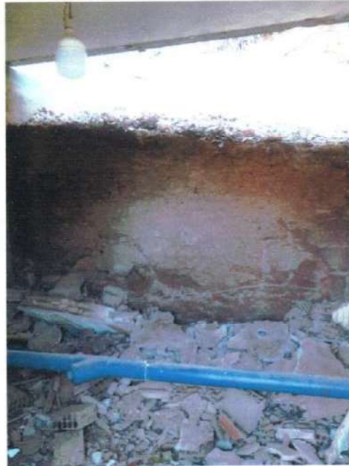
Figura 14; parede do booster caiu.