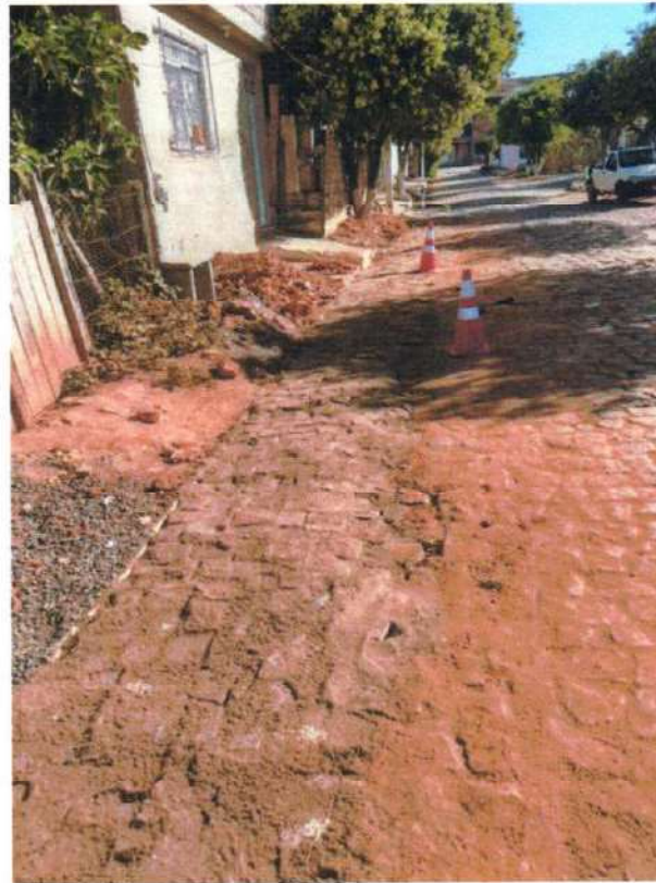
Figura 18; repavimentação em ligação nova no bairro cidade Nova

Lembrando ainda que a empresa, colocou à disposição da população um SAC-0800, 24 horas por dia, assim como números de watsapp e está trabalhando incansavelmente para atender a população com dignidade, respeito, qualidade e agilidade, através de profissionais capacitados e treinados para exercer de melhor forma a sua função.