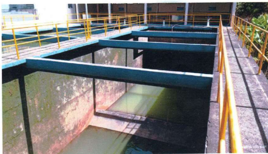
Figura 13; ETA já limpa e enchendo.