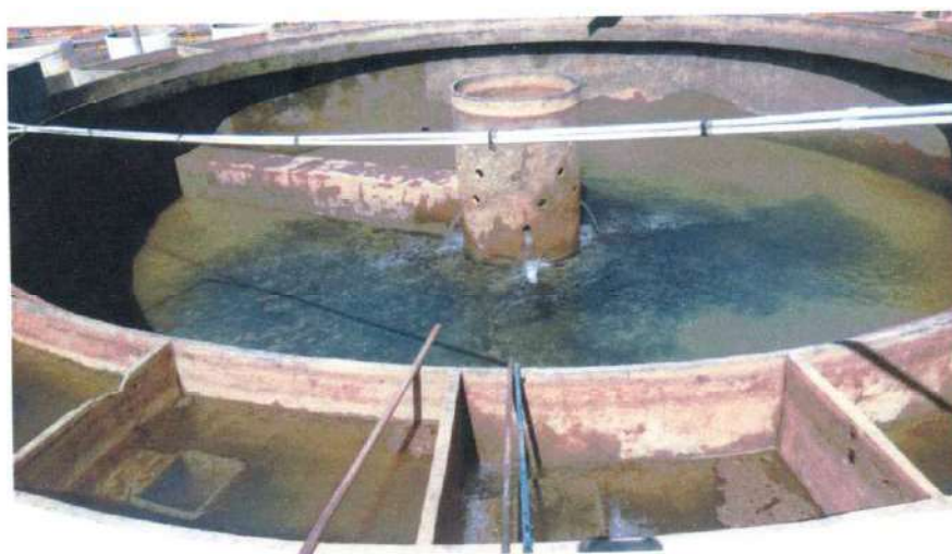
Figura 7; decantador já limpo