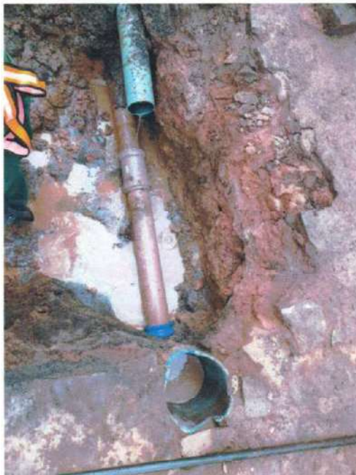
Figura 2; manutenção emergencial Bairro 17.