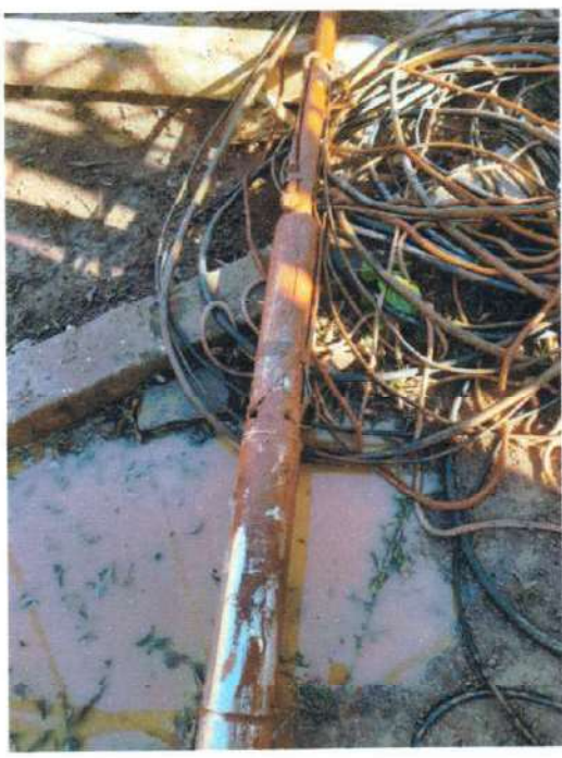
Figura 5; retirada da tubulação e bomba para limpeza.