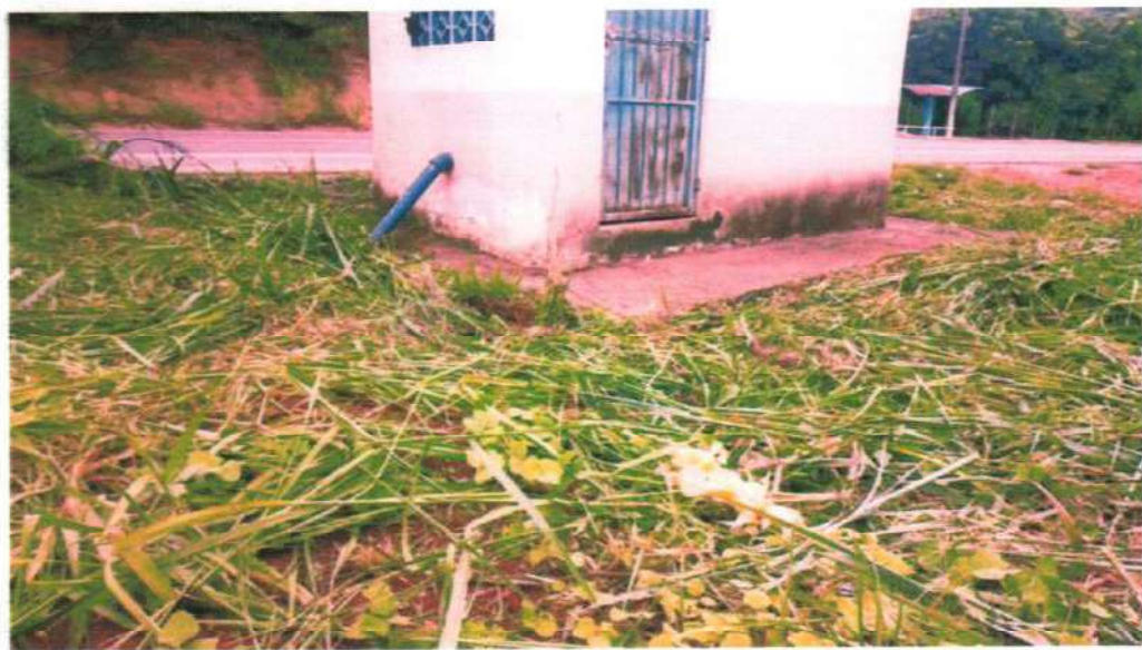
Figura 12;roçada e limpeza no booster café garoto.

Lembrando ainda que a empresa, colocou à disposição da população um SAC-0800, 24 horas por dia, assim como números de watsapp e está trabalhando incansavelmente para atender a população com dignidade, respeito, qualidade e agilidade, através de profissionais capacitados e treinados para exercer de melhor forma a sua função.