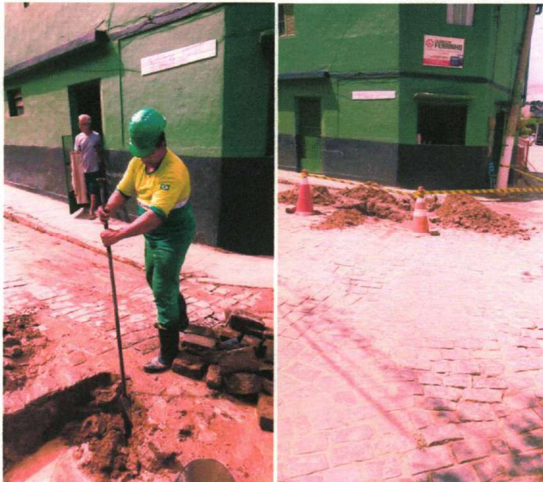
Figura 2 e 3 ; abertura de buraco para realização de manutenção no distrito de Ibitinema.