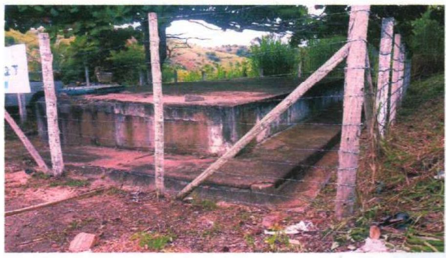
Figura 10;roçada e limpeza no reservatório de Marangatu

São realizados serviços de roçadas, capinas, varrição e limpezas em todos boosters, etas, reservatórios e dependências do sistema, para manter em condições de uso.