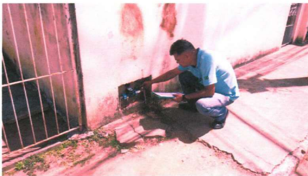
Figura 1 ; fiscal de leitura realizado serviços de leitura e cadastros.