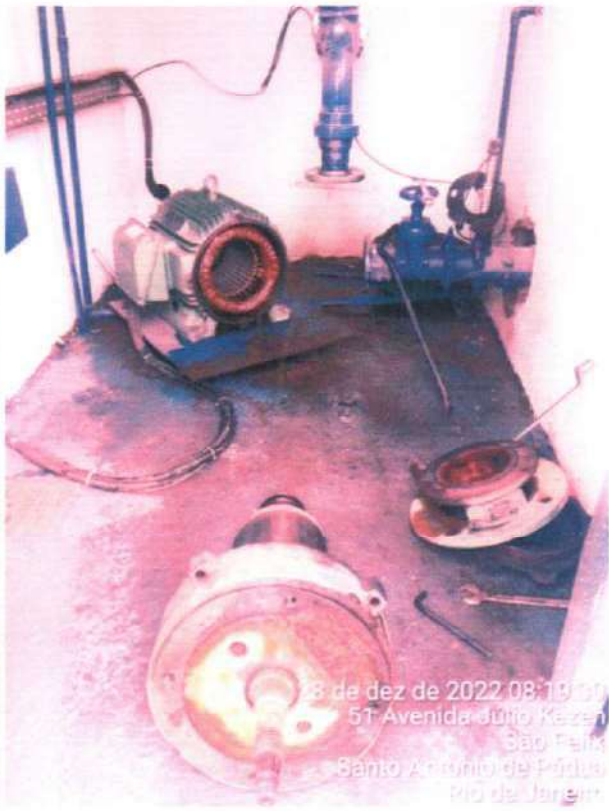
Figura 6 e 7 ; troca de rolamentos e selo mecânico para melhor funcionamento do sistema.