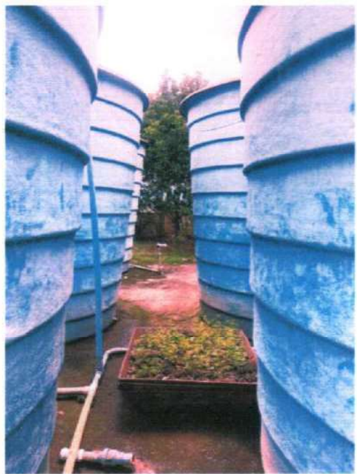
Figura 11;roçada e limpeza no reservatório de Monte alegre