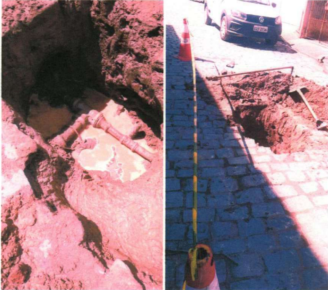
Figura 4 e 5 ; serviço já executado e sinalizado no distrito de Ibitinema.