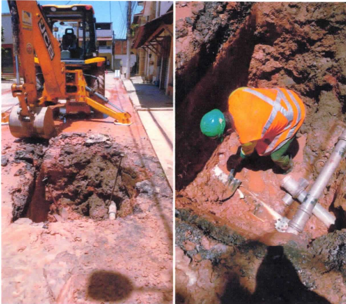
Figura 8 e 9 ;Manutenção corretiva de rede DN 100mm no bairro São Luis.