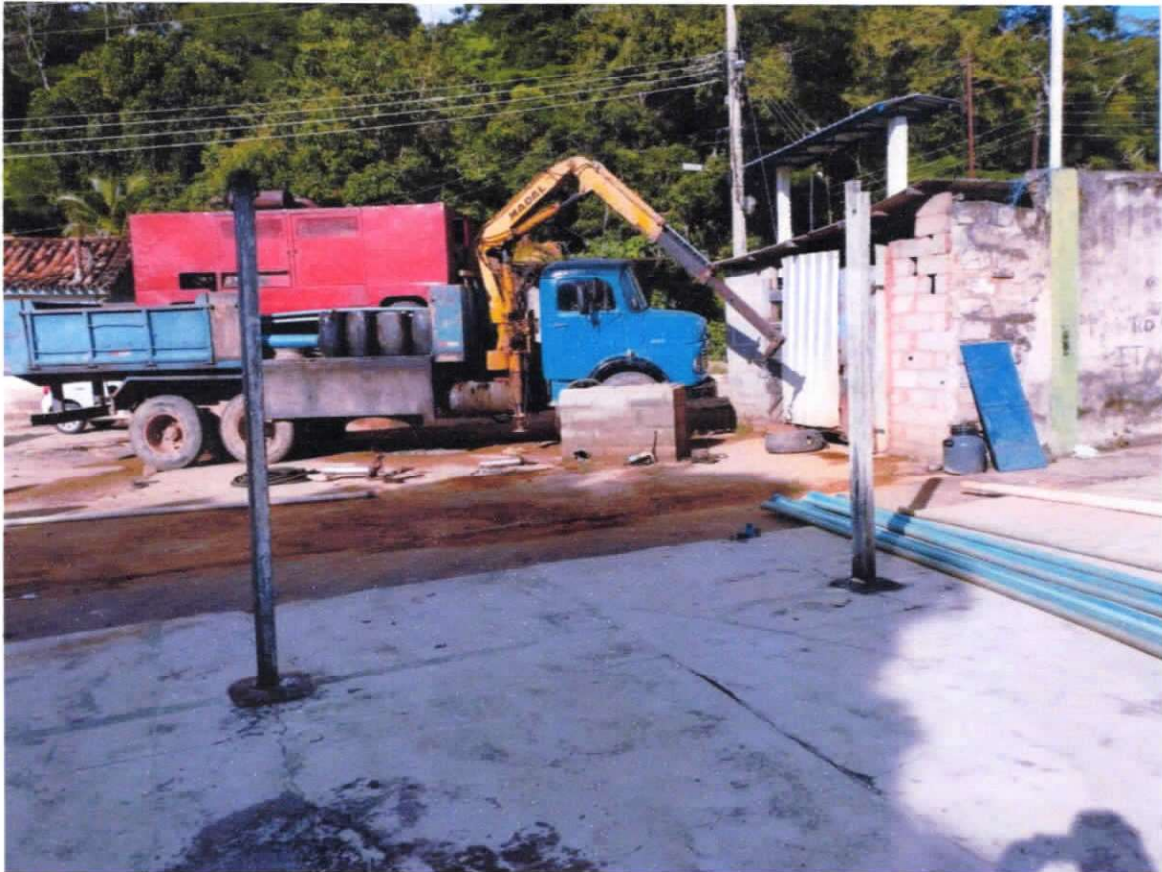
Figura 2 ; retirada de bomba e canos para limpeza do poço próximo a quadra .