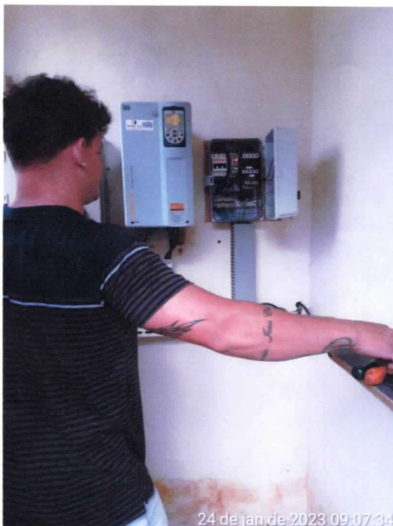
Figura 11 ; Manutenção do Inversor na ETA de Ibitinema.

A empresa vem aprimorando o sistema de controle e automatização das ETAs e elevatórias, visando o melhor controle, abastecimento e diminuindo o desperdício de produtos e energia.