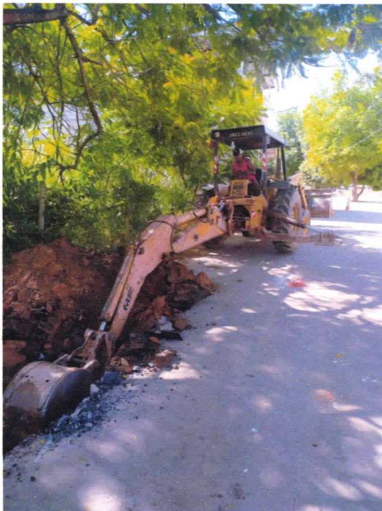
Figura 10 ;Manutenção corretiva e emergencial no Bairro Cehab.