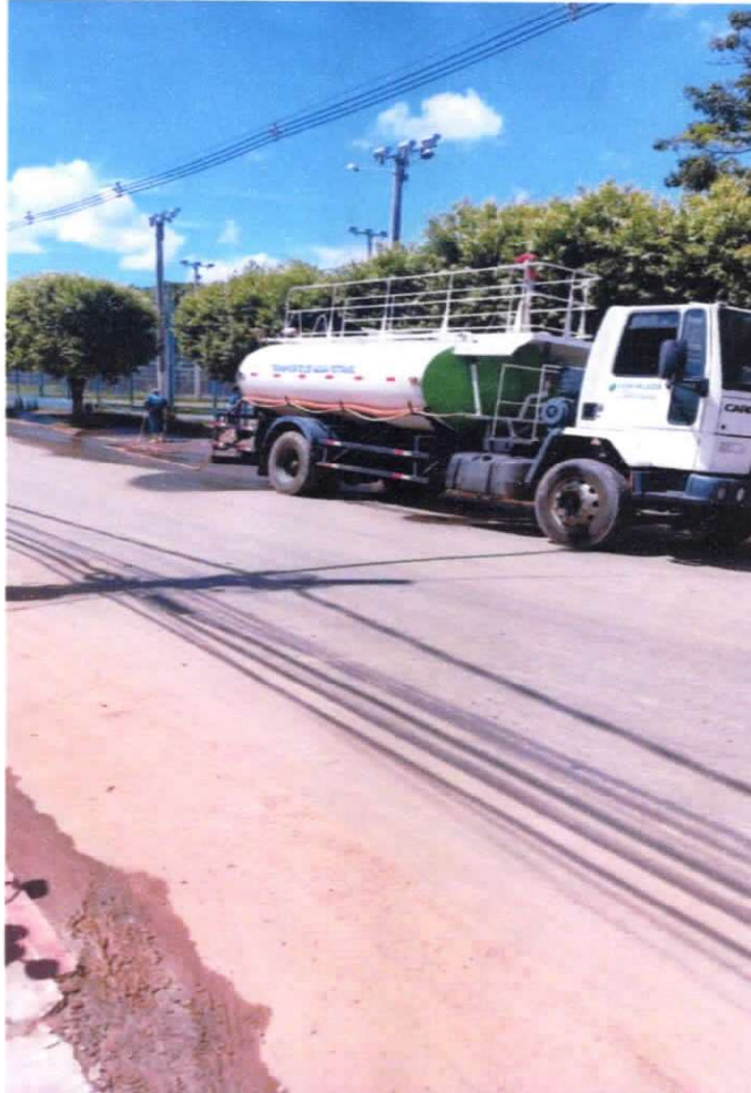
Figura 1 ; caminhão pipa ajudando na limpeza das ruas do município .