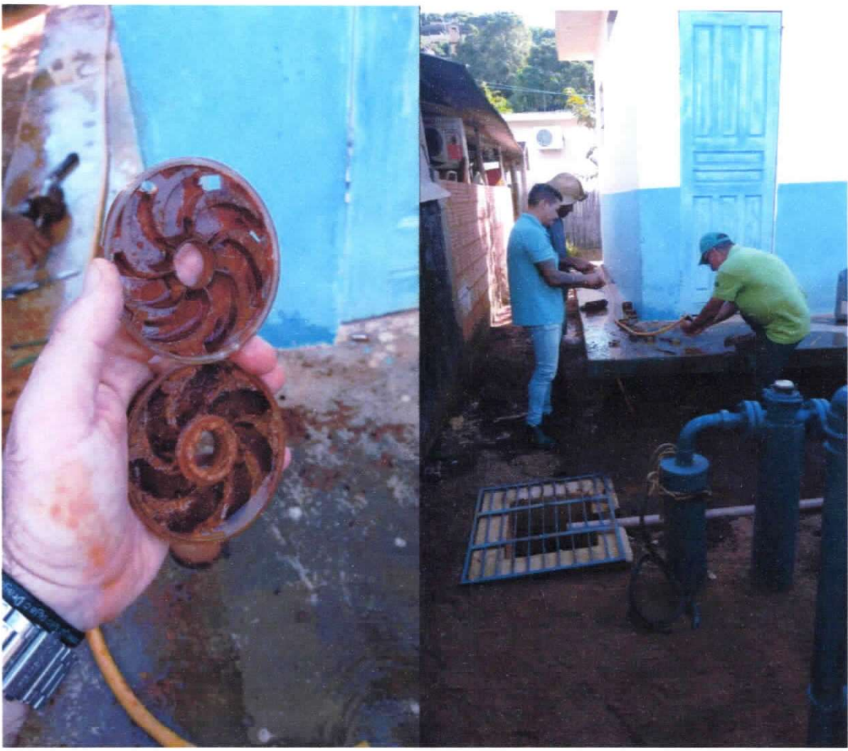
Figura 3 e 4 ; limpeza e manutenção da bomba e rotor.