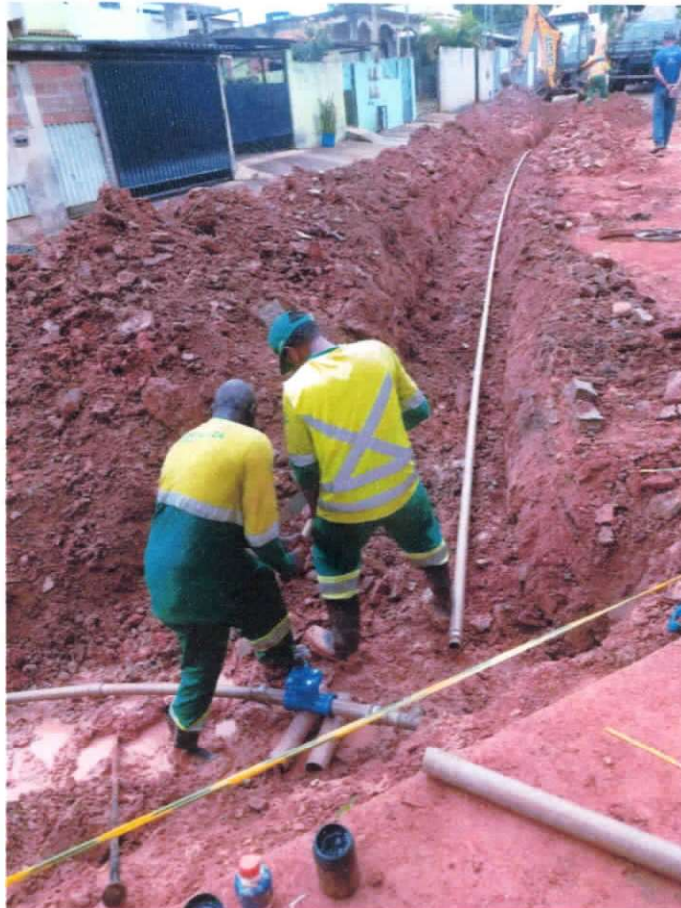
Figura 5 ; troca de rede de abastecimento no bairro de Ibitinema, para melhorar e ampliar o abastecimento da localidade.