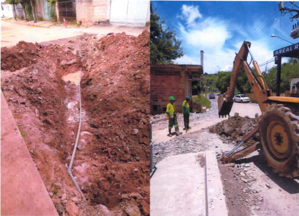
Figura 6 e 7 ; Interligação definitiva na Ponte do Bairro Carvalho.