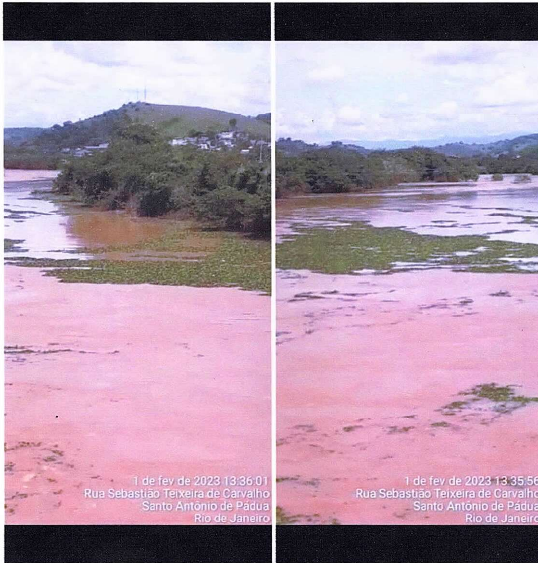
Figura 1 e 2 ; plantas aquáticas descendo no Rio Pomba.