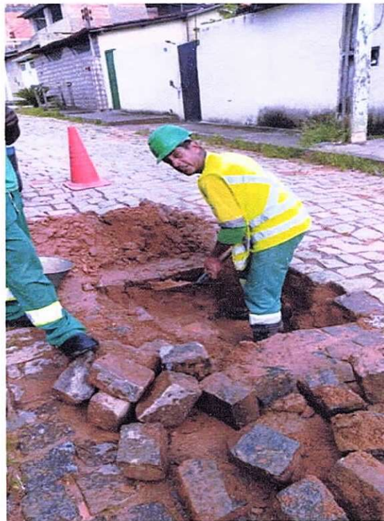
Figura 16 ; manutenção em ramal no Bairro Cidade Nova