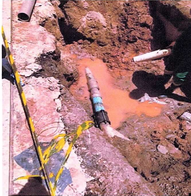
Figura 15 ; manutenção em rede de abastecimento morro da Borracha