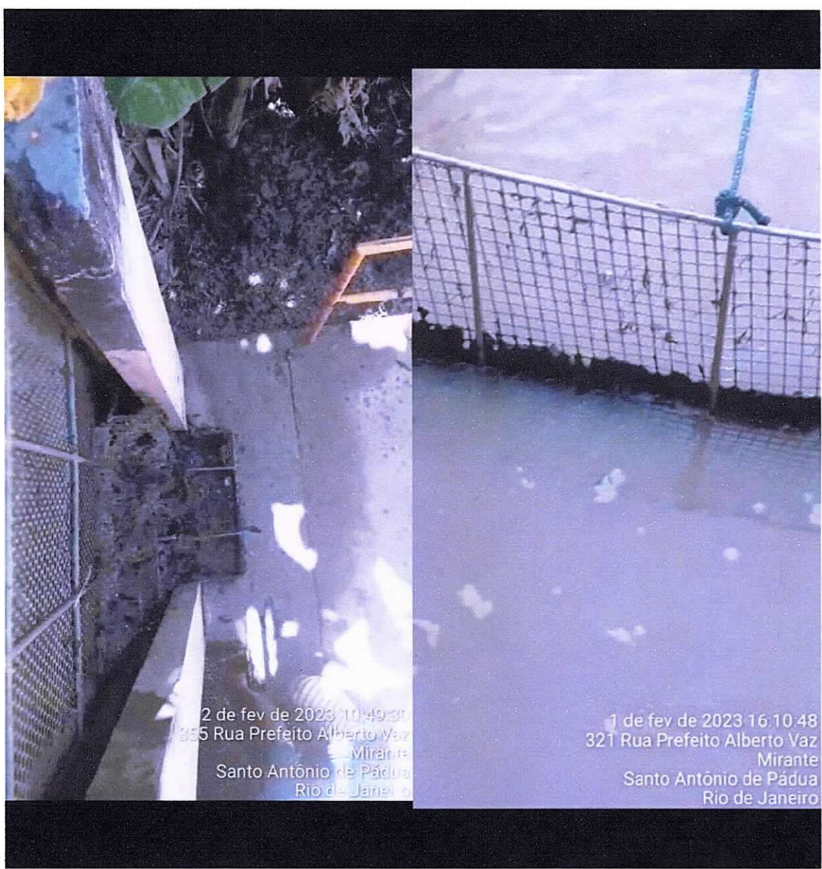
Figura 3 e 4 ; telas de limpeza primaria obstruídas pelas plantas aquaticas.