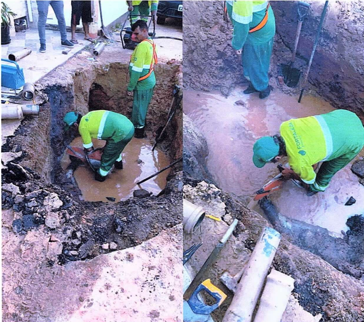
Figura 13 e 14 ; manutenção em rede de abastecimento próximo ao Booster do Aeroporto.