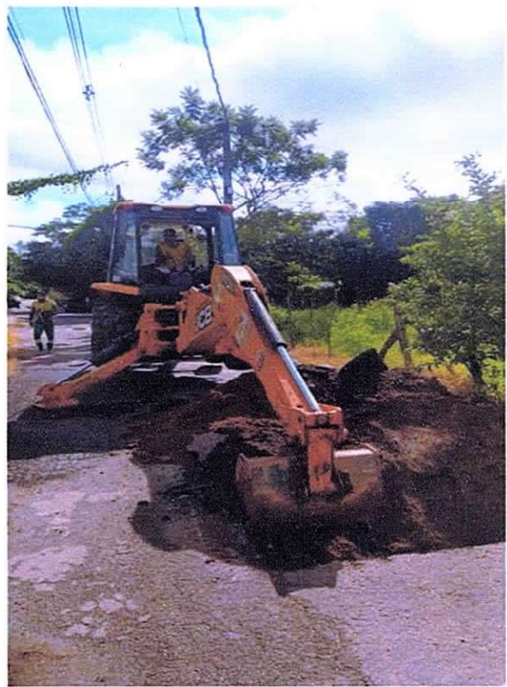
Figura 19 ; Ligação Nova no Bairro Santa Afra

Lembrando ainda que a empresa, colocou à disposição da população um SAC-0800, 24 horas por dia, assim como números de watsapp e está trabalhando incansavelmente para atender a população com dignidade, respeito, qualidade e agilidade, através de profissionais capacitados e treinados para exercer de melhor forma a sua função.