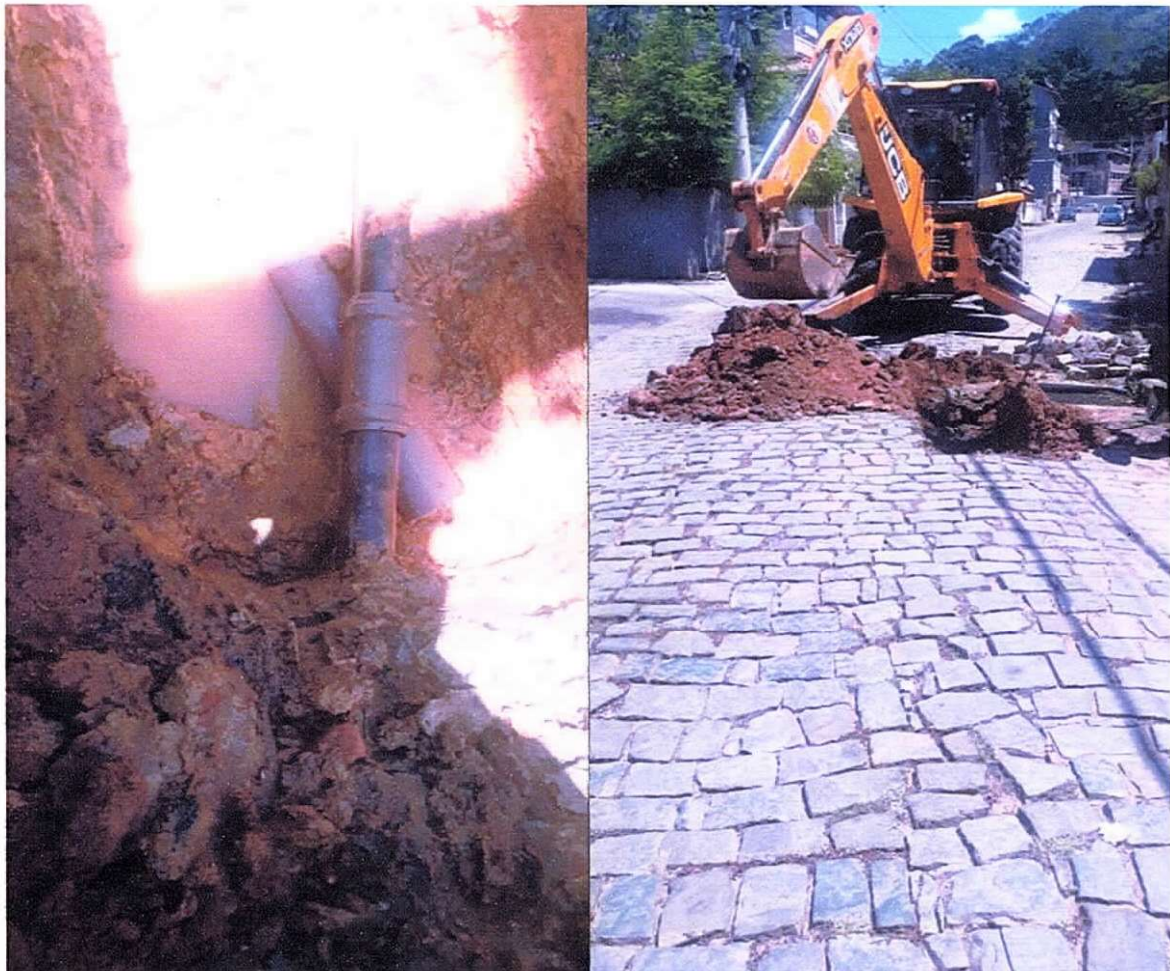
Figura 17 e 18 ; manutenção em rede no bairro cidade Nova