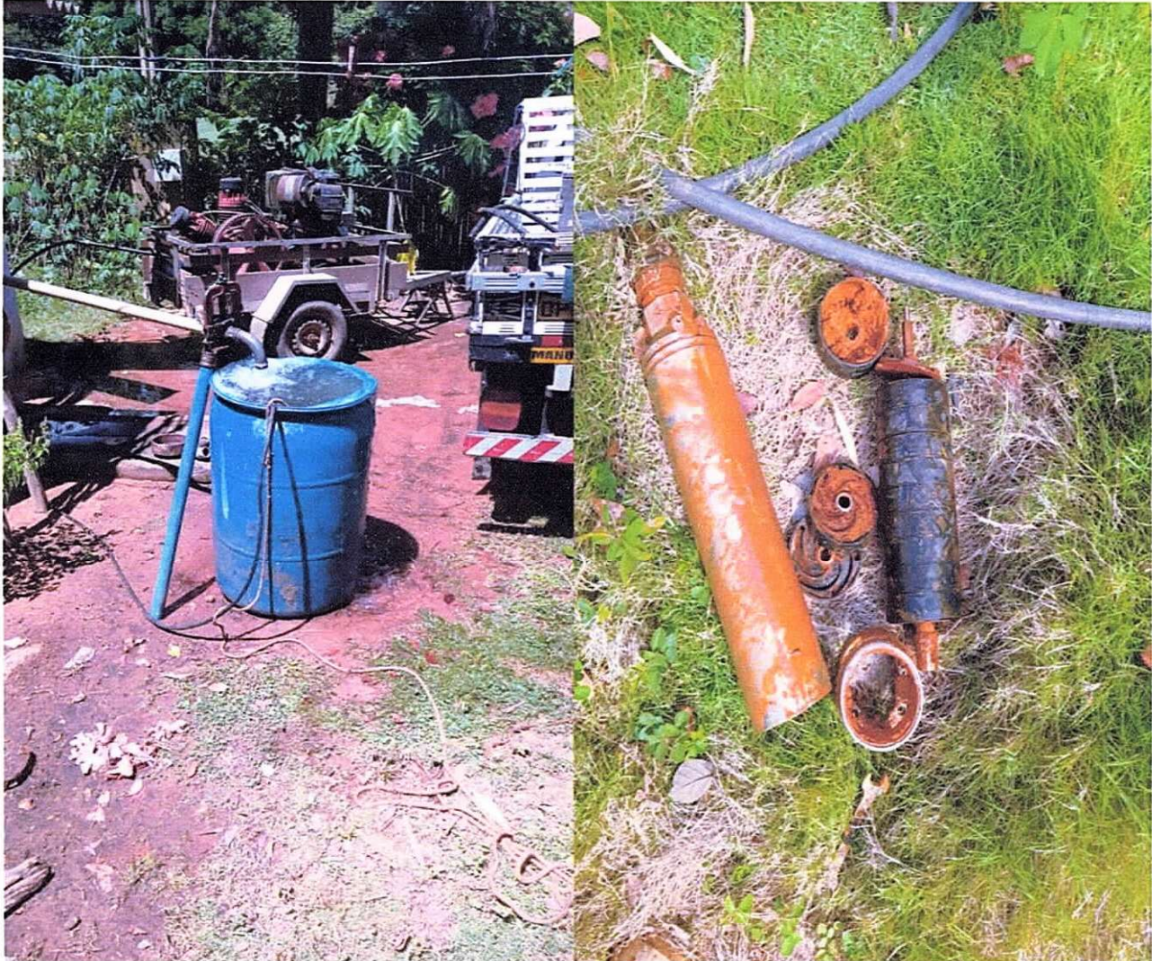
Figura 9 e 10 ; limpeza do poço por empresa especializada e troca do rotor da bomba submersa.