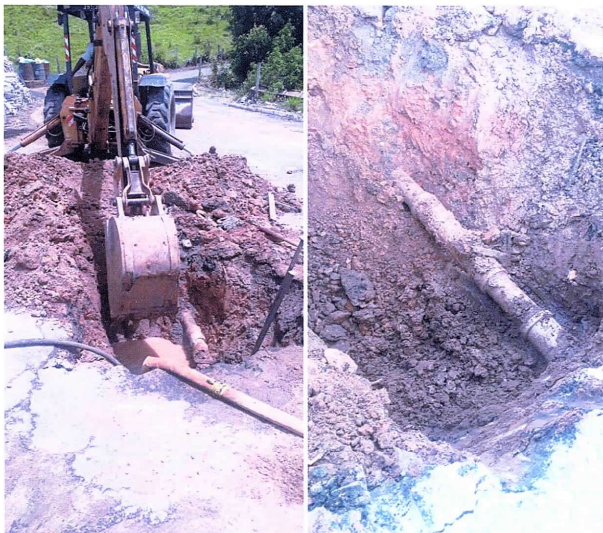
Figura 11 e 12 ; manutenção em rede de abastecimento no distrito de Marangatu.

A seguir algumas das manutenções em redes e ramais que são realizadas pela empresa durante todo o ano, todos os dias para atender com presteza os munícipes sem destinação.