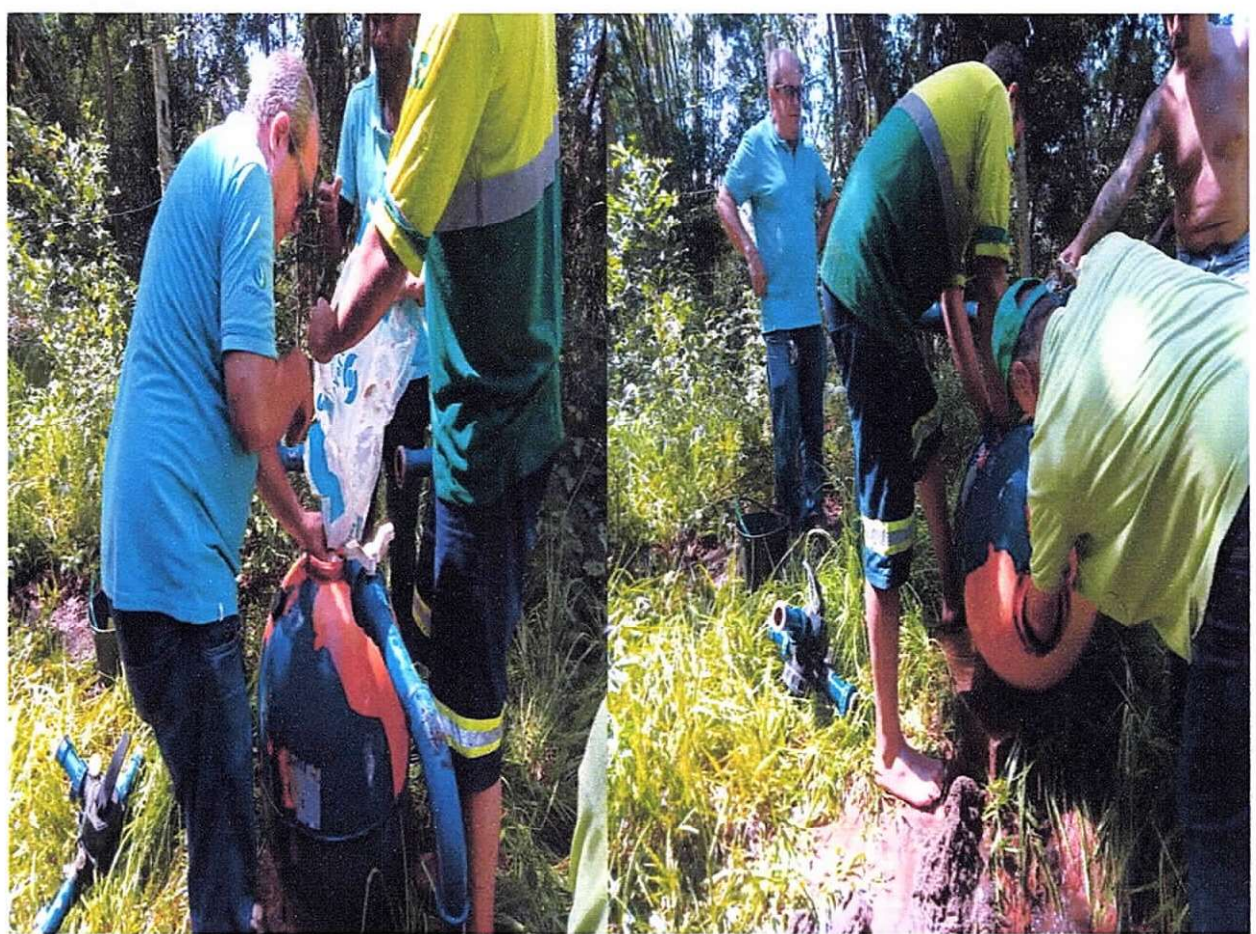
Figura 7 e 8 ; Funcionarios da empresa fazendo a retirada e troca do material filtrante.