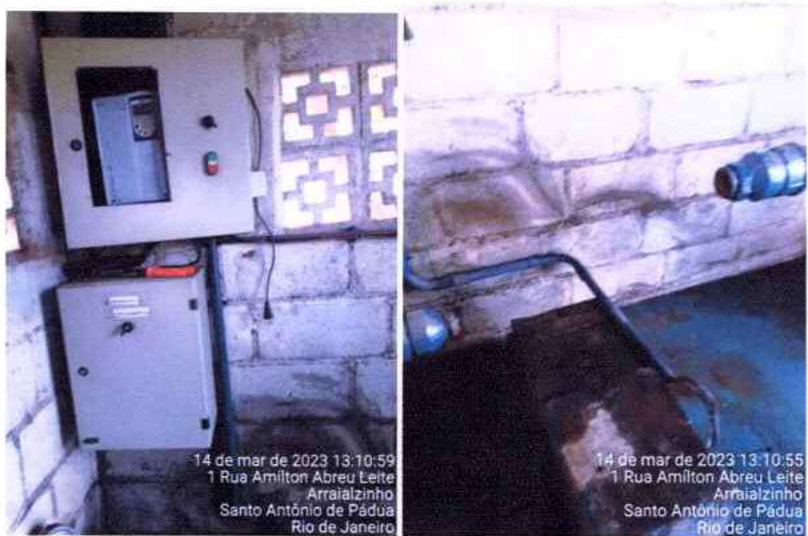
14 de mar de 2023 13:10:59 1 Rua Amilton Abreu Leite Arraiázinho Santo Antônio de Pádua Rio de Janeiro

São realizadas manutenções periódicas, preventivas e corretivas em todas elevatórias e recalques do Município e distritos a fim de manter o pleno funcionamento do sistema.