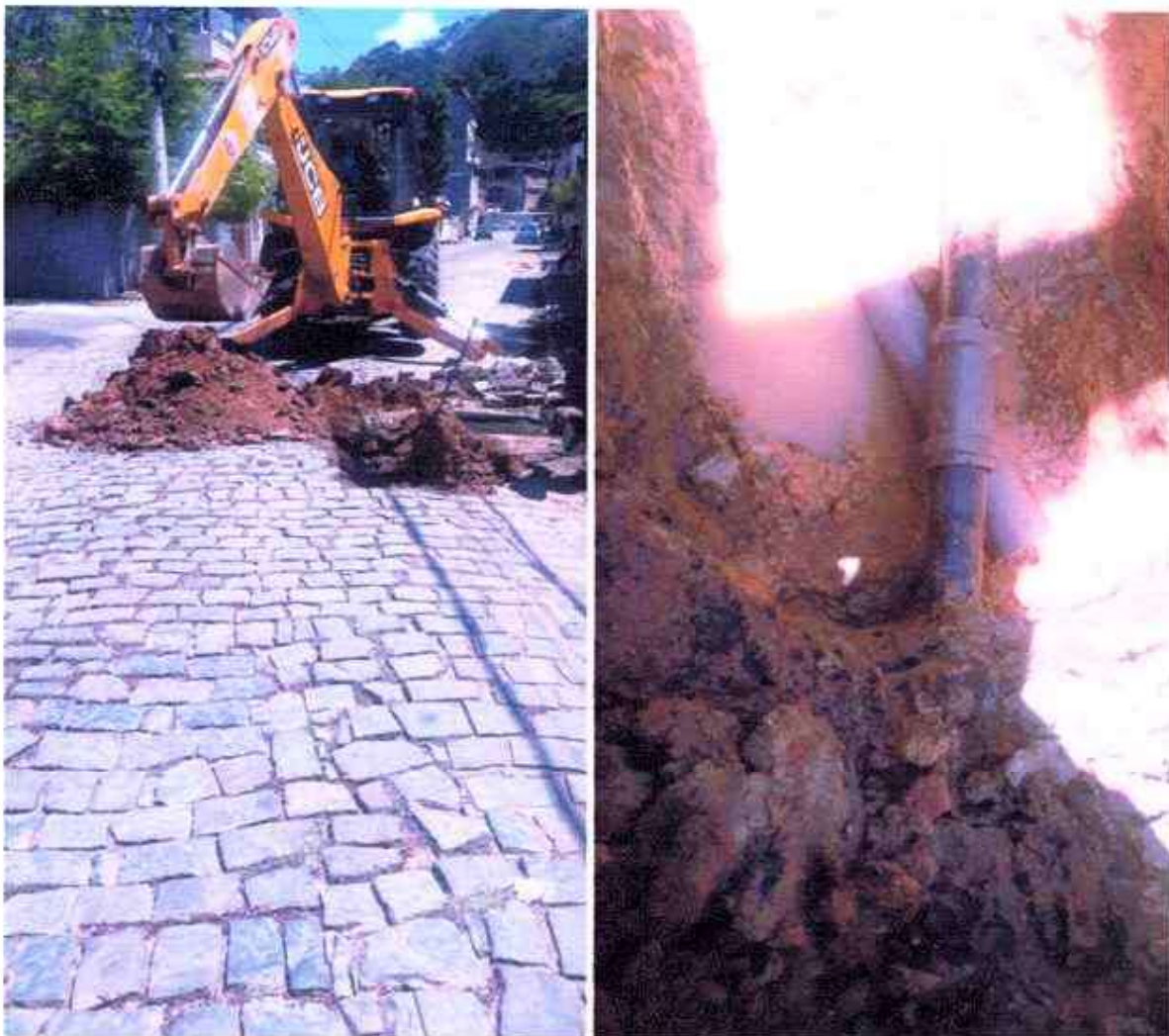
Figura 11 e 12 ; manutenção em rede de abastecimento no bairro Divinéia.

A seguir algumas das manutenções em redes e ramais que são realizadas pela empresa durante todo o ano, todos os dias para atender com presteza os munícipes sem distinção.