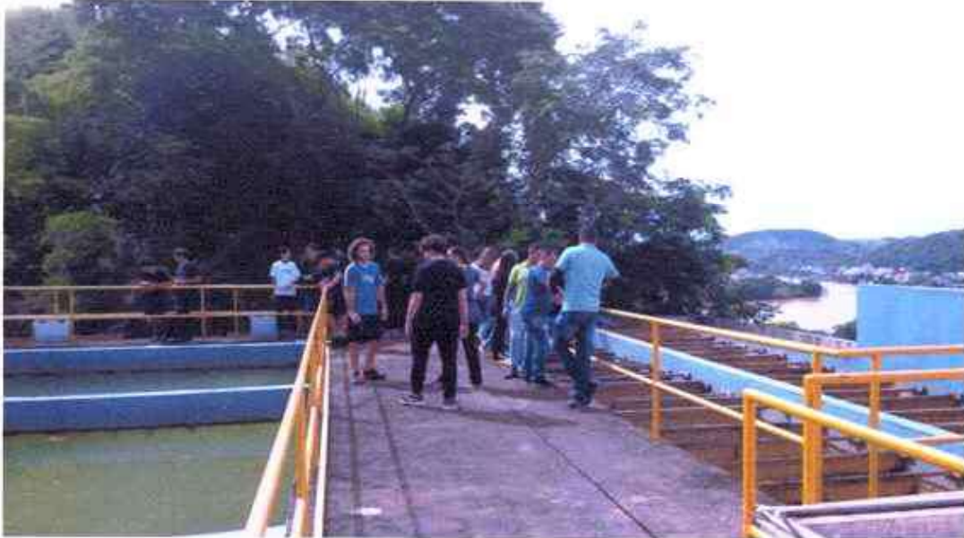
Figura 5 ; Alunos do 1º ano do Ensino médio visitando as dependências da ETA.