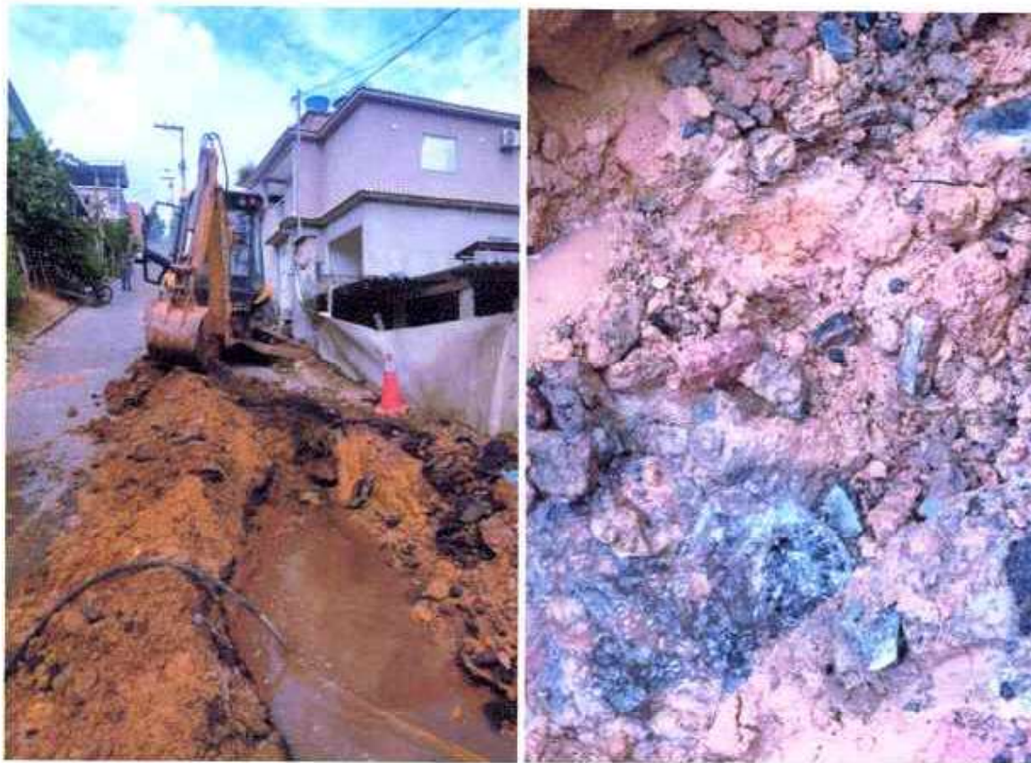
Figura 13 e 14 ; Verificação de válvula de retenção no distrito de Ibitinema afim de manutenção preventiva.