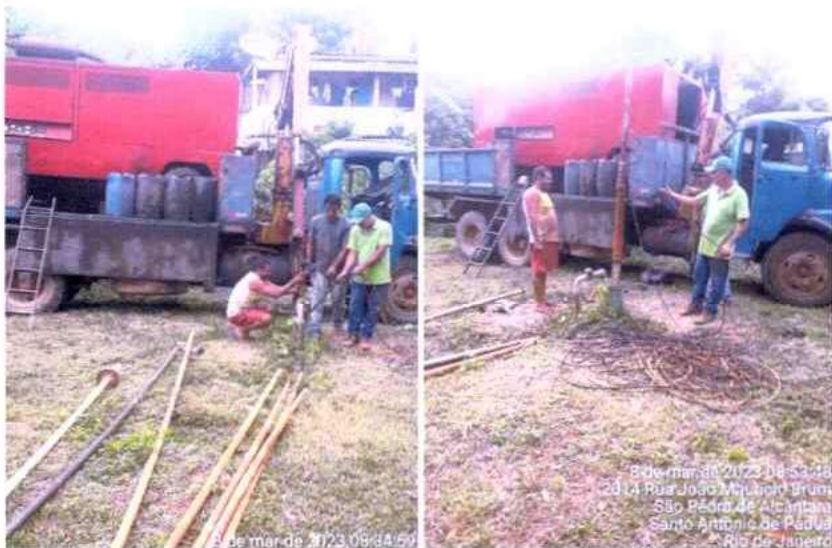
Figura 1 e 2 funcionários da empresa especializada fazendo a limpeza do poço .

Foi realizada a limpeza do poço que abastece a localidade, para aumento da vazão e melhoria do abastecimento.