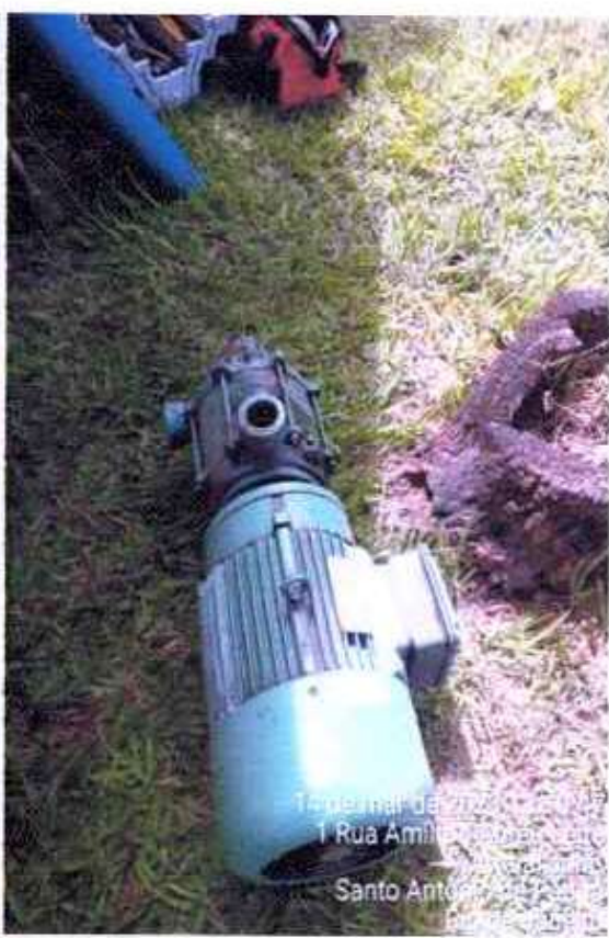
Figura 9 e 10 ; substituição de bomba para manutenção preventivas com lubrificação e troca de rolamentos, no caso foi feita a substituição da bomba para não parar o sistema.