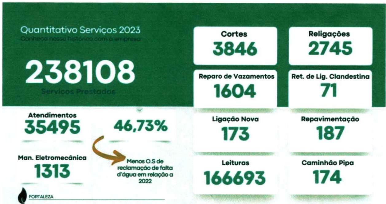
Figura 6: Quantitativo de alguns serviços prestados no decorrer do ano de 2023

importante, onde conseguimos diminuir de um ano para o outro quase 50% de reclamação de falta d'água em nosso atendimento.