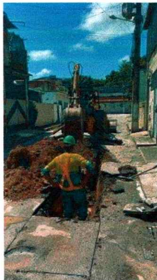
Figura 1: Execução de reparo de vazamento de rede