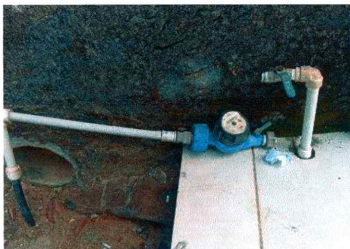
Figura 3: Cavalete quebrado no distrito de Santa Cruz