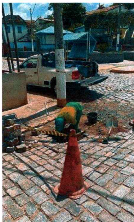
Figura 2: Execução de reparo de vazamento de ramal