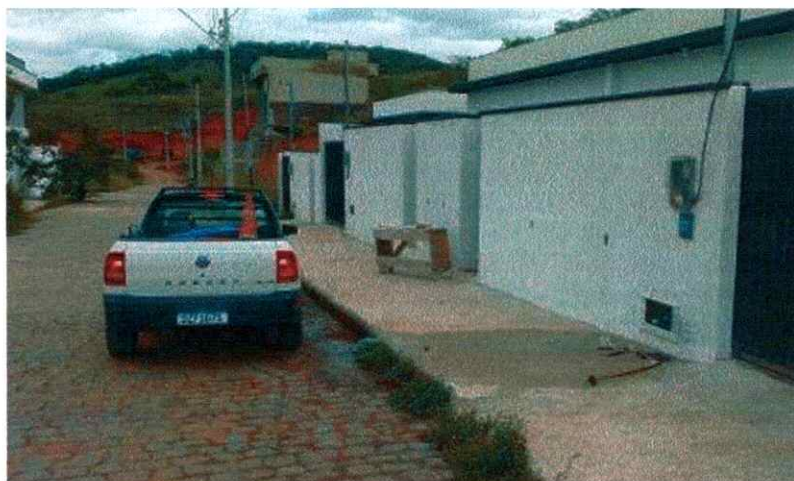
Figura 4: Execução de ligação nova

Para nos auxiliar na execução dos reparos de vazamentos, ligações novas, extensões de redes e demais serviços que demandam a utilização da retroescavadeira, foram gastos 27 horas de serviço da mesma. Utilizamos 19 m 3 de material de envoltória de rede e recomposição de solo para realização de repavimentação, podendo ser, com capa asfáltica ou paralelo.