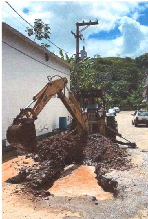
Figura 1: Reparo de vazamento de rede no Bairro Arraialzinho