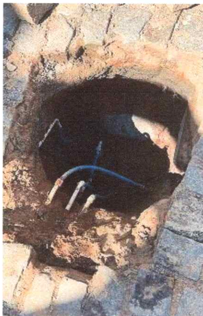
Figura 2: Reparo de vazamento de ramal na Av.Souza