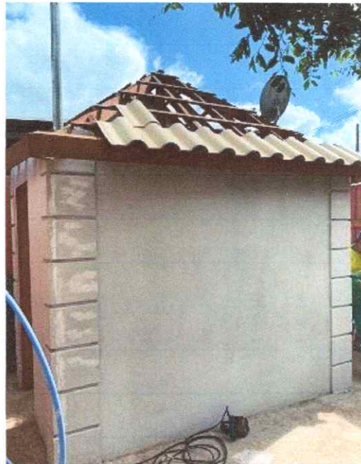
Figura 5: Instalação de telhas da cobertura