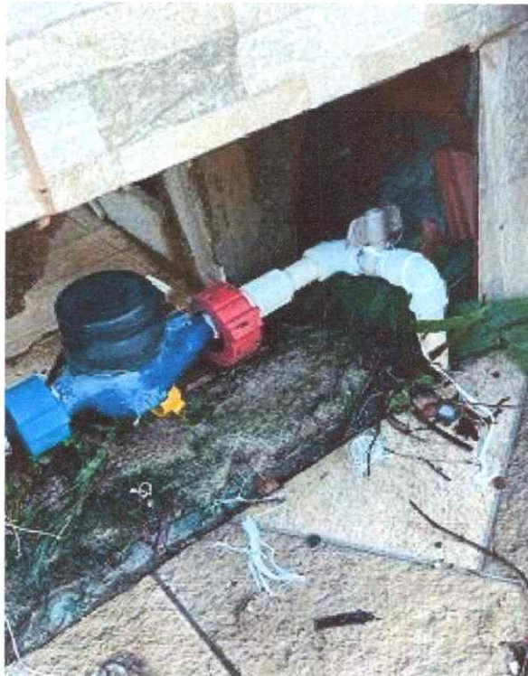
Figura 4: Hidrômetro com abastecimento interrompido por falta de pgto.