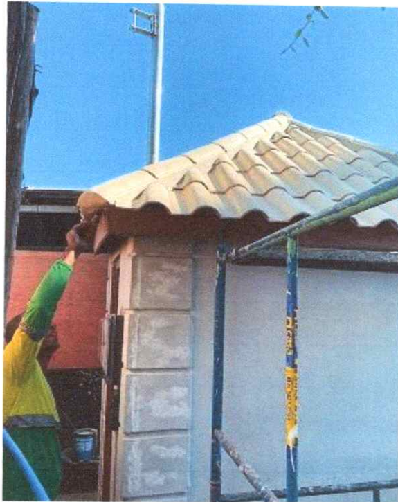
Figura 7: Execução de pintura para acabamento do telhado