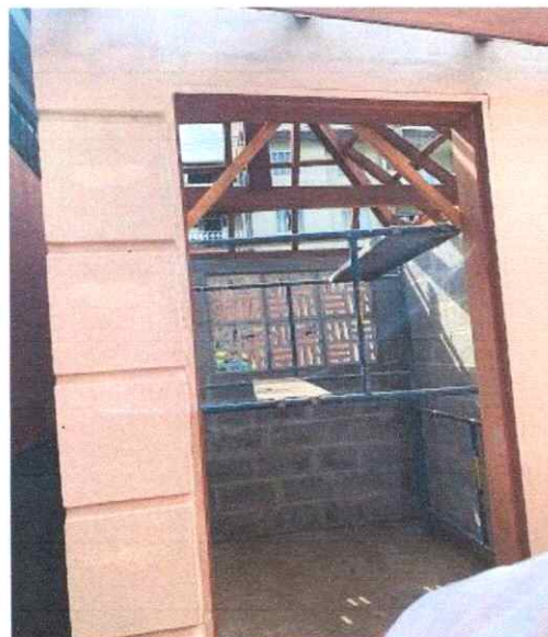
Figura 6: Instalação de aduela de porta