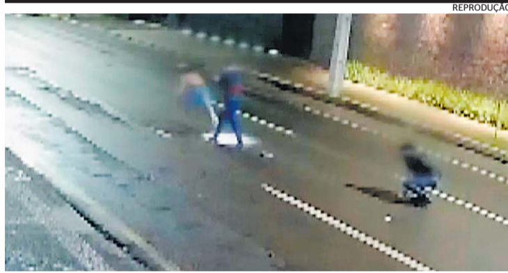
Câmera de monitoramento mostrou agressão em via pública

do respeito e parte para agressão não nos representa. Oportunamente, aclamamos o resultado do concurso, parabenizamos os organizadores e já convidamos a Miss Mato Grosso Gay 2023 para estar no trio principal da 20ª Parada do Orgulho LGBTQIA+ de Mato Grosso", diz o comunicado que foi publicado ontem no Instagram da instituição. ✕