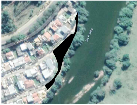
LOCALIZAÇÃO Esc. aproximada 1/1500