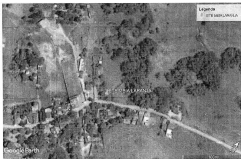
Figura 01 – Coordenadas Geográficas do local 21°32'10.91"S, 42°13'1.21"O.