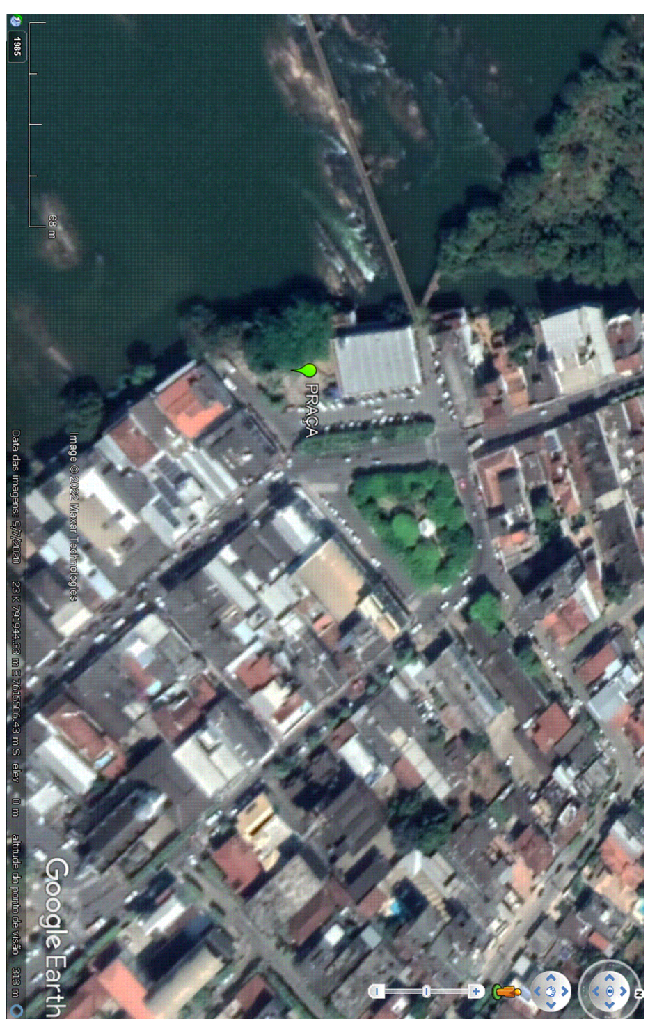
PLANTA DE LOCALIZAÇÃO "GOOGLE EARTH"